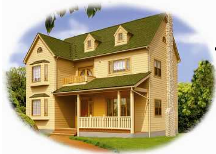
写真はモデルハウスです